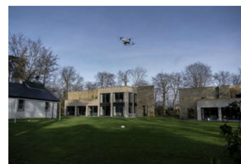
Manna lève 25 millions de dollars pour élaborer des projets pilotes de livraison par drone aux Etats-Unis