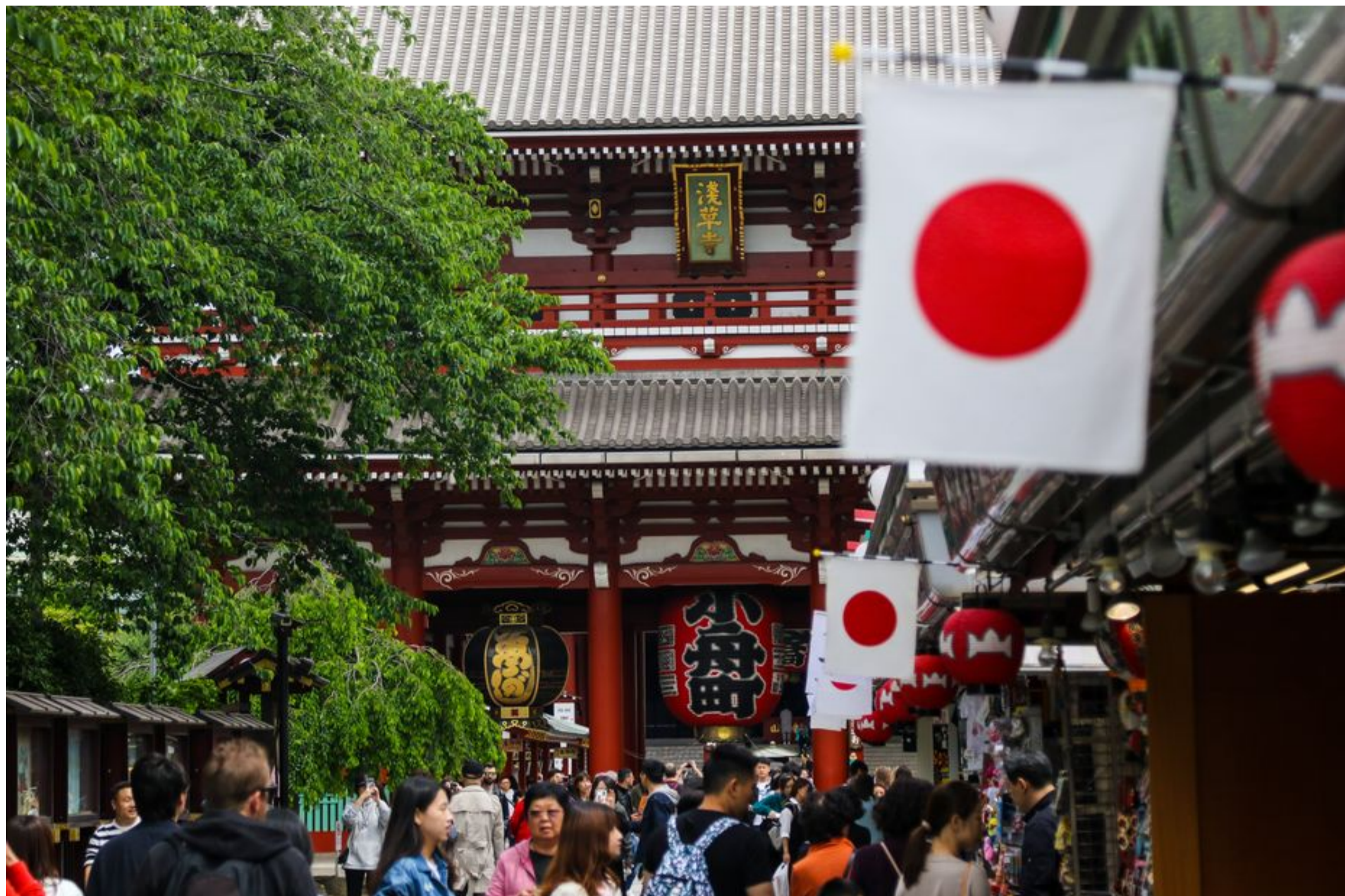
Le Japon annonce la création d'une cryptomonnaie souveraine pour 2021