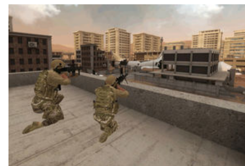
Facebook acquiert Downpour Interactive, le studio derrière le jeu de réalité virtuelle Onward