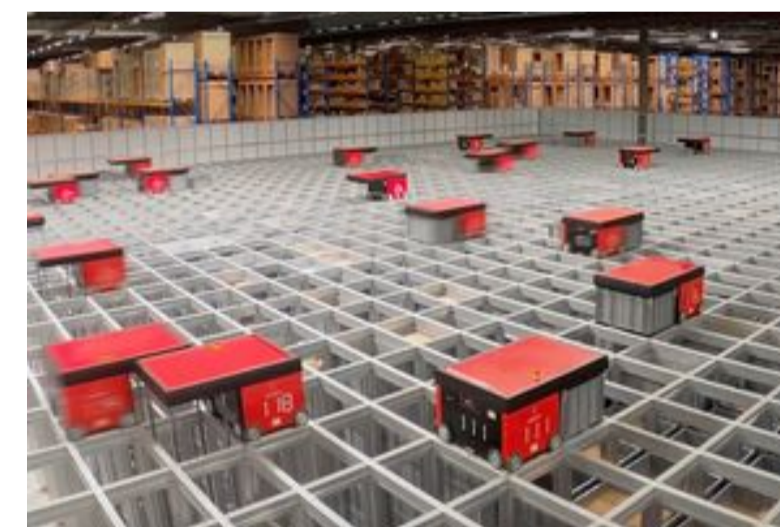
UPS se laisse séduire par les entrepôts automatisés d'AutoStore